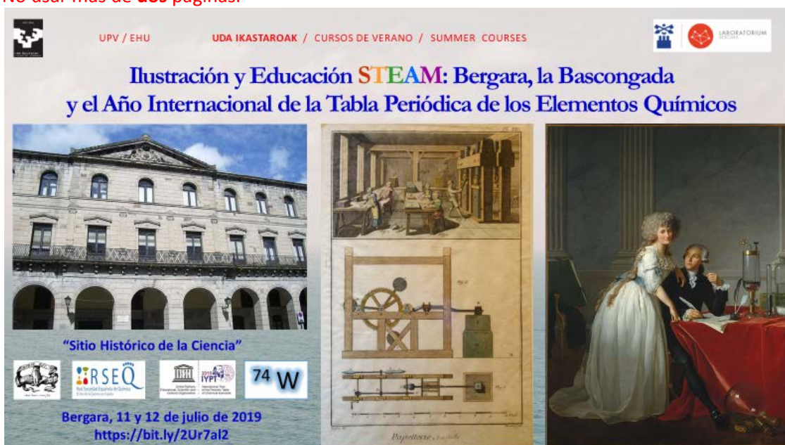
Figura 2: Cartel anunciador del Curso de Verano “Ilustración y educación STEAM: Bergara, la Bascongada y el Año Internacional de la Tabla Periódica de los Elementos Químicos (2019)”